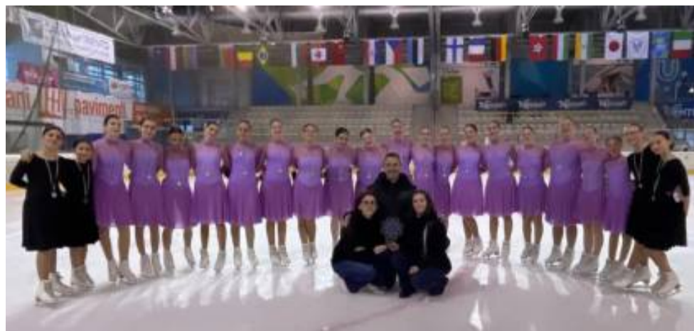
Le Ice Diamonds in gara sul ghiaccio di Trento nell'ultima performance agonistica della stagione

Nel frattempo per ampliamento del proprio organico, le Ice Diamonds sono alla